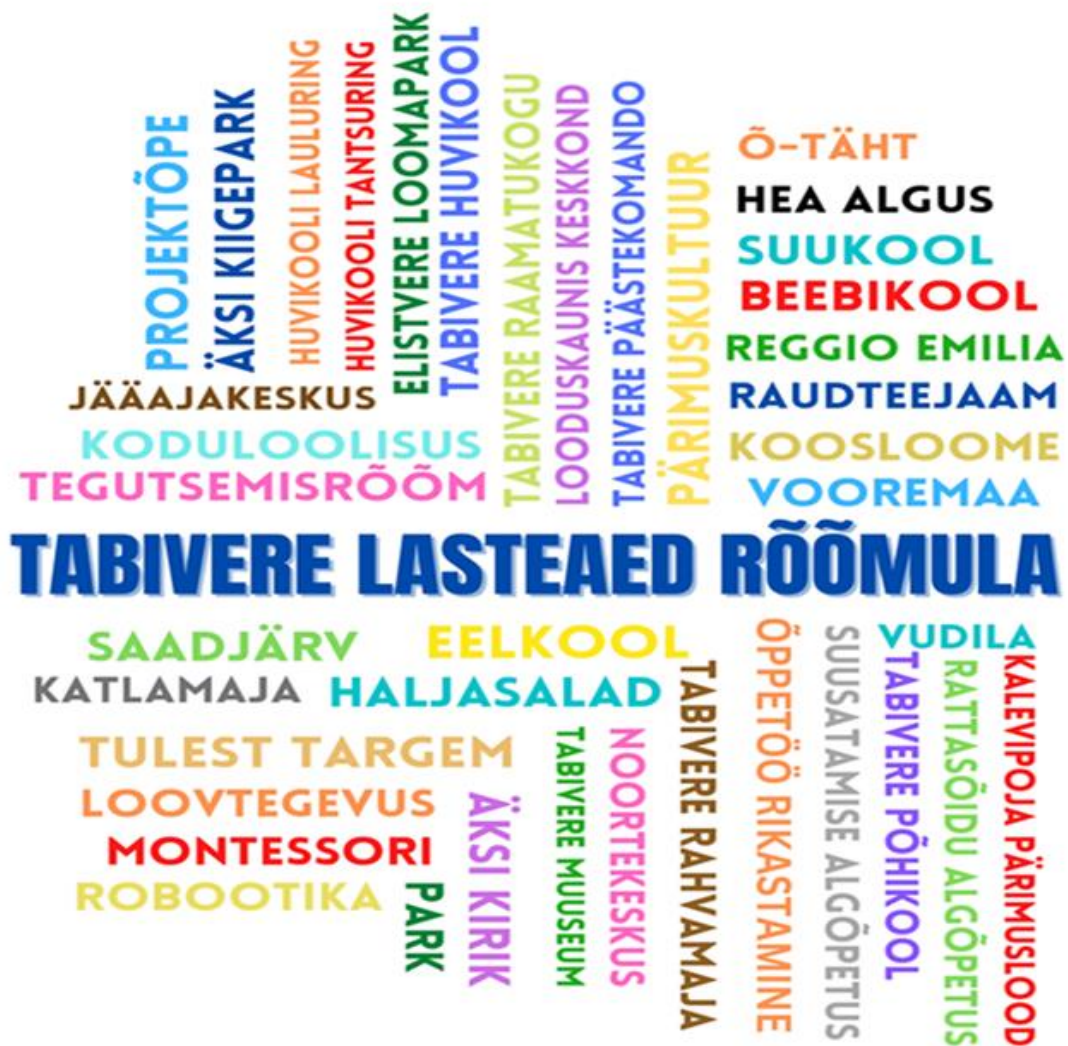
Joonis 2. Lisaväärtused meie ümber

Meie eripära- oleme täiesti tavaline lasteaed mitmekülgses keskkonnas, kus peetakse olulisteks häid suhteid ja kuhu nii väikesed kui ka suured rõõmuga tulevad!