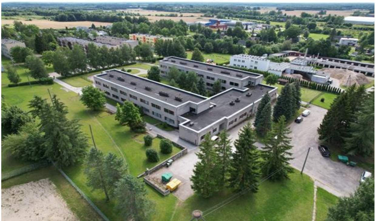
Joonis 1. 40 aastane Tabivere lasteaed